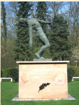
Le monument commémoratif

Le monument commémoratif érigé à l'intérieur de cimetière représente un homme en train de tomber, œuvre du sculpteur Cor Van Kralingen. Sur le socle sont gravés les mots: