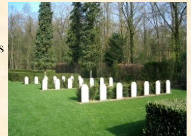
Un carré de stèles (entrée coté droit)

L'inauguration solennelle a eu lieu le 3 mai 1958 en présence du ministre des anciens combattants et victimes de guerre et de l'ambassadeur des Pays-Bas. En ce lieu reposent 114 victimes de guerre, tant militaires que civiles.