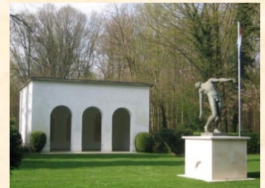
Le portique d'honneur face au monument commémoratif face au pavillon d'honneur

Le monument commémoratif érigé à l'intérieur de cimetière représente un homme en train de tomber, œuvre du sculpteur Cor Van Kralingen. Sur le socle sont gravés les mots: