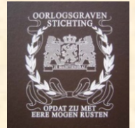
Ecusson de l'OORLOGSGRAVEN STICHTING

a été aménagé au cœur de la forêt de Chantilly sur la commune d'Orry-la-Ville, par la fondation des sépultures de Guerre des Pays-Bas (OORLOGSGRAVEN STICHTING), en étroite collaboration avec les autorités françaises, afin de garantir l'entretien des tombes de guerre Néerlandaises en France.